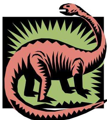
Podpis do obrazu/grafiki

Jeśli wystarczy miejsca, umieść tu obiekt ClipArt lub inną grafikę.